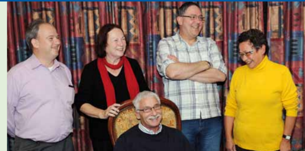
Ten slotte zijn we nog bezig aan diverse zaken die zijn aangebracht tijdens de dorpspreekuren.

Met de bewonersgroep Grijze Wijk hebben we voor het hertenkamp een passende oplossing gezocht om samen met de gemeente het hertenkamp te behouden. Met de klankbordgroep voor het project Langstraat hebben we een aantal praktische zaken besproken, met name gelet op de veiligheid. De verbeteringen zijn inmiddels grotendeels gerealiseerd. Samen met de bewonersgroepen uit de overige kernen in de gemeente werken we aan het project Dorpsignaal, waarbij ons dorp als één van de pilot locaties is benoemd.